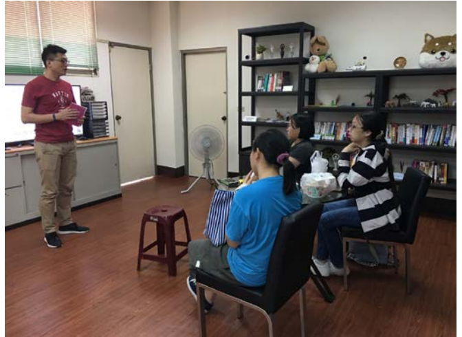
▲講師與學生討論電影映後心得