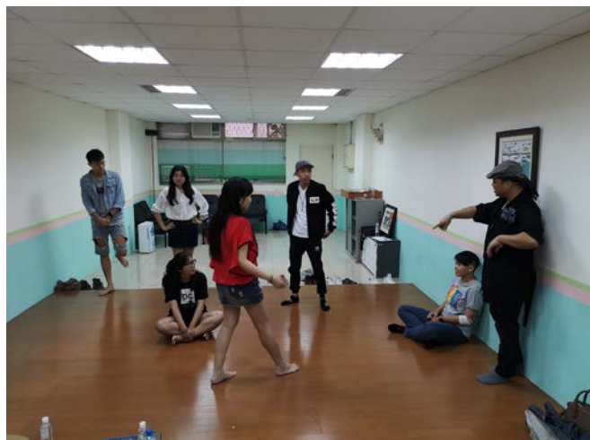
▲ 透過光譜演練，讓學生了解個別差距