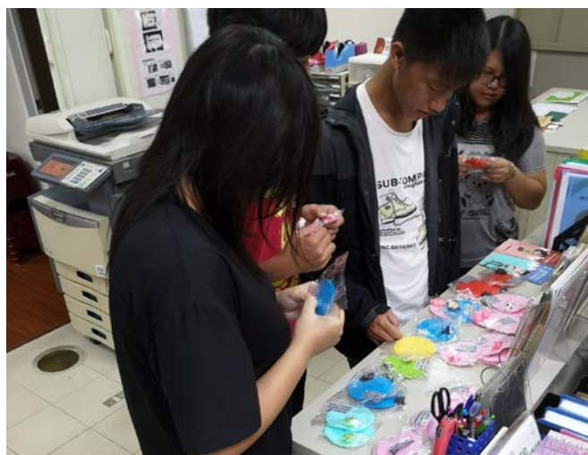
▲ 有獎徵答禮物挑選