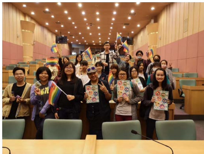
▲ 講座結束後的大合照