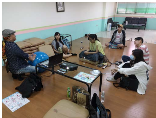
▲ 講師分享成長故事