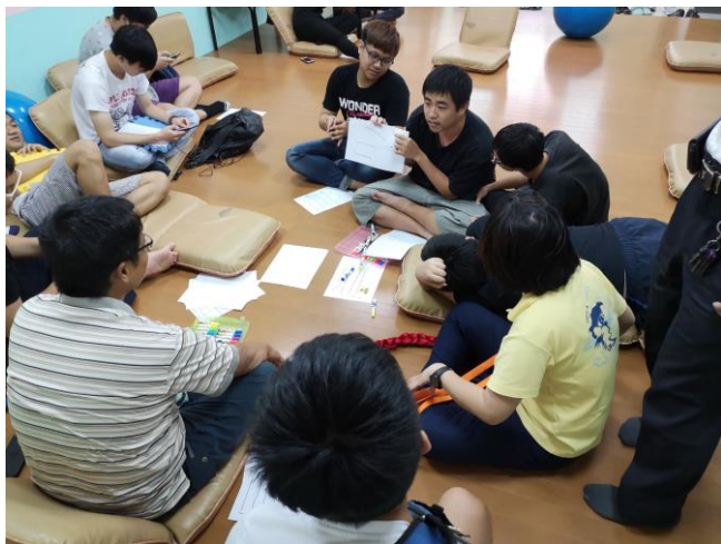
▲參與學生逐一分享心得