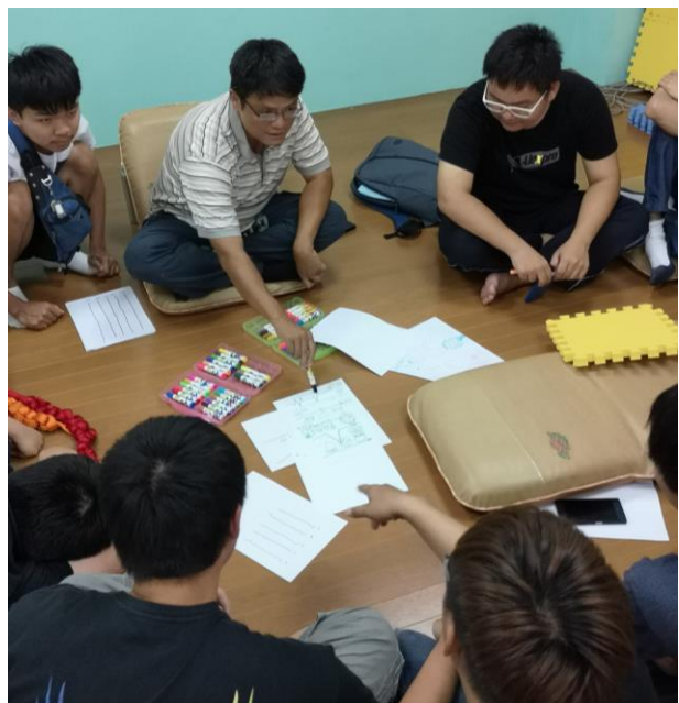
▲講師帶領分享活動