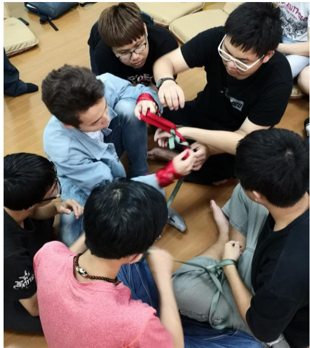
▲學生參與挑戰活動