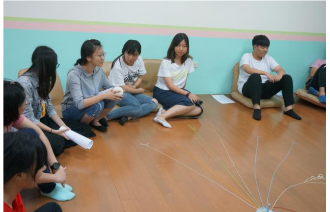
▲參與學生逐一分享心得