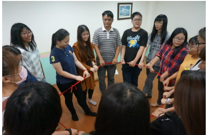
▲ 參與學生逐一分享心得