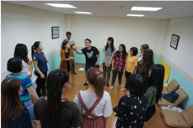
▲ 參與學生認真投入團體活動