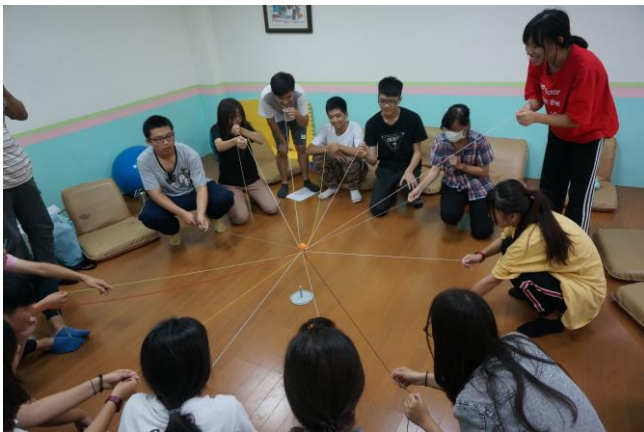
▲透過團體挑戰活動，讓參與學生增加自信