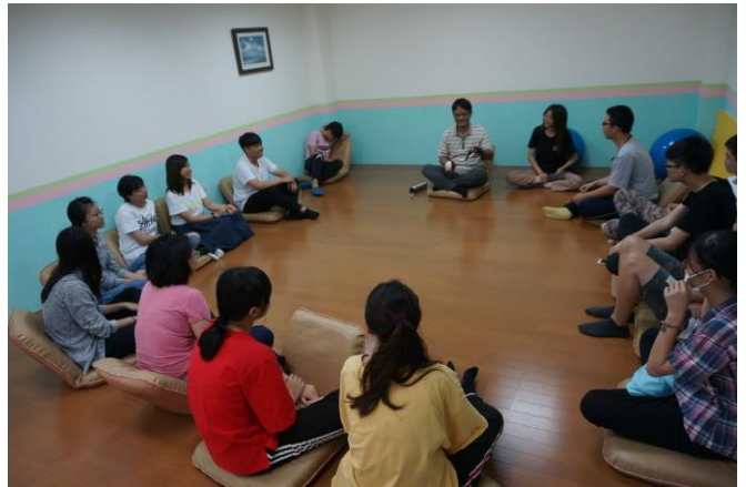
▲講師自我介紹並帶領破冰團體遊戲