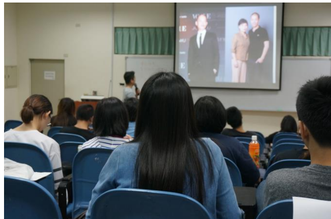
▲與會人員與講師互動