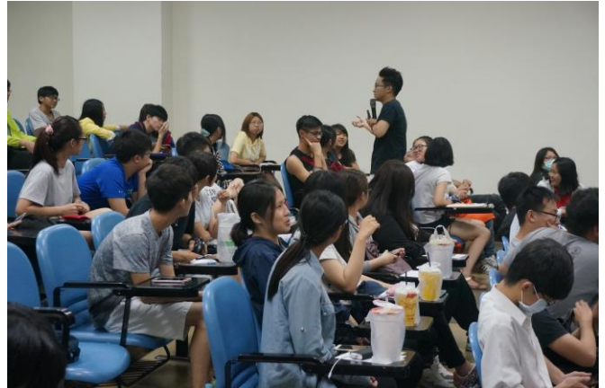
▲與會人員與講師互動