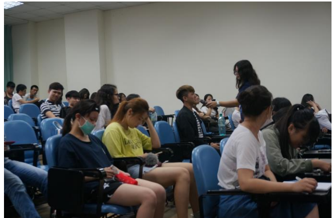
▲與會人員與講師互動