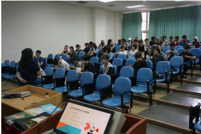
▲與會人員認真聽講