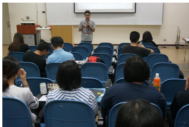
▲與會人員認真聽講