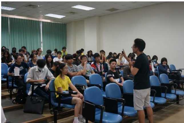
▲與會人員認真聽講