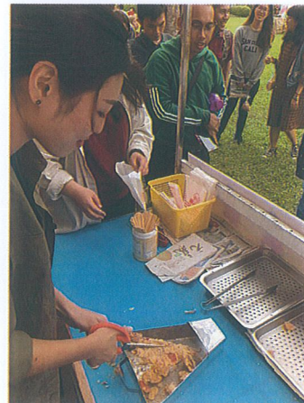
職人炸魷魚邀請同學共同製作