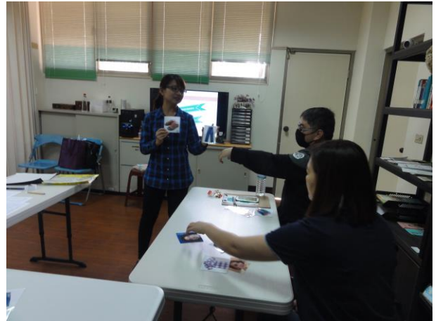
選擇合宜的服裝儀容