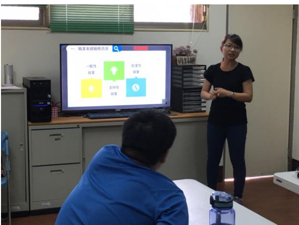
介紹職業重建服務